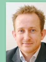
Bent Holm LandboGruppen A/S

Minikonferencen finder sted fredag d. 27. maj kl. 10.00-11.00 i frokostteltet på dyrskuepladsen. Tilmelding på tlf. 74 36 50 00 senest mandag d. 23. maj