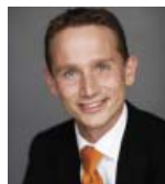
Kristian Jensen Skatteminister

Vi glæder os til et spændende seminar og håber at se dig.